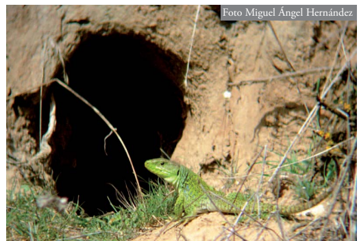
Figura 2. Un lagarto ocelado vigila mientras se calienta al sol en la entrada de una conejera. Los cerros de Alcalá de Henares, 2008.

Por tanto, la presencia del conejo, también de otros mamíferos excavadores (tejón, Meles meles ; zorro, Vulpes vulpes ; rata parda, Rattus norvegicus ) y de aves que abren galerías donde nidificar (abejaruco, Merops apiaster ; martín pescador, Alcedo atthis ; avión zapador, Riparia riparia ), facilitaría el refugio al lagarto ocelado y a otros reptiles y anfibios que se instalan en las huras abandonadas (Tabla 1). Donde el refugio es un factor limitante, el rol de las especies ingenieras es clave para diversificar la herpetofauna (Lomolino & Smith, 2003). Gálvez-Bravo et al. (2009) esta-